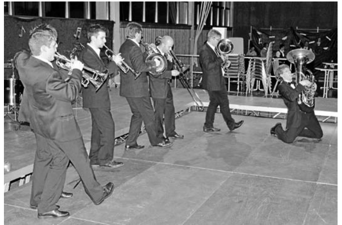
„Die Phantastischen 8“ während ihrem notenfreien Showbeitrag