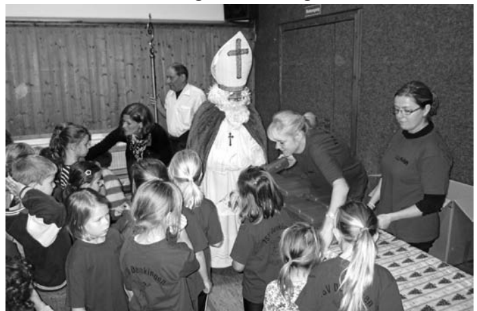
Der Nikolaus verteilt die Geschenke

Auch wir machen eine Pause über die Weihnachtstage. Wir treffen uns in diesem Jahr letztmalig am Mittwoch, 21.Dez. 2011 , wie immer um 16.00 Uhr in der Alten Turnhalle.