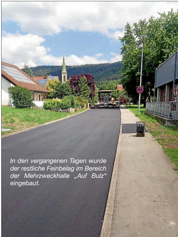
In den vergangenen Tagen wurde der restliche Feinbelag im Bereich der Mehrzweckhalle „Auf Bulz“ eingebaut.