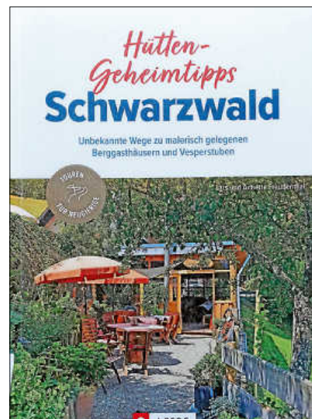
Schwarzwald Geheimtipps